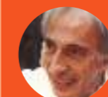
Иван Иллич (1926–2002)

известная книга — «Педагогика угнетенных», один из основополагающих текстов критической педагогики. Впервые была издана в 1968 году.