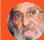
Паулу Фрейре (1921–1997)

Фрейре стартует с того, что в современном обществе существует проблема угнетения. То есть люди стремятся реализовать себя, но в силу того, как