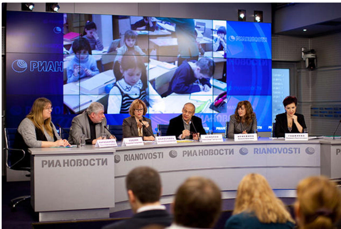
Круглый стол «Каким быть дошкольному детству?» 2 апреля 2013 года

А другой учитель — это [философ] Мераб Мамардашвили и его формула: если мой народ выберет [Звиада] Гамсахурдию (грузинский диссидент, первый президент Грузии), я не буду со своим народом. Он читал нам лекции, и мы как замороженные слушали его — неважно, психологи мы были, философы, физики или кто-то еще. Вот когда ты сталкиваешься с людьми, которые меняют твой масштаб жизни как личности, как для меня меняли Тендряков, Окуджава и Мамардашвили, ты понимаешь, что самое опасное — это превратиться в человека, который ищет любое оправдание себе в принятой роли. Я расстреливаю, потому что у меня был приказ, я здесь ни при чем. И начинается великое бегство от «личности», от свободы.