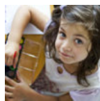
Как реагировать на детские фантазии?