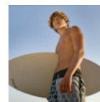
Он больше не хочет отдыхать вместе с нами